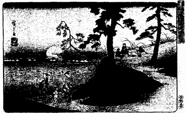
図2 「道灌山虫聞之図」（足立区立郷土博物館所蔵）

展示を見ると、⑩江戸時代のころ、開成学園の周辺では野菜づくりもさかんだったようです。谷中しょうが、三河島菜といった名産品も生まれました。また、開成学園のあるところは秋田藩の屋敷でしたが、江戸時代の中ごろから、このあたりには他にも藩の屋敷が数多くつくられたことがわかりました。その理由を学芸員の人に聞いてみると、「（3）とけんかは江戸の華」といわれるくらい、江戸では（3）が多かったために、江戸の中心から郊外に藩の屋敷を移すよう幕府が命じたからだそうです。