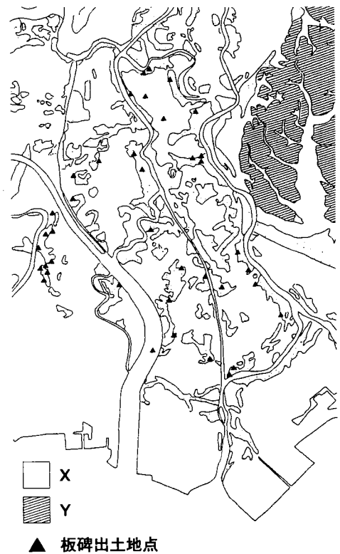
図1 下町低地で発見された板碑の分布 (熊野正也編『東京低地の古代』による)